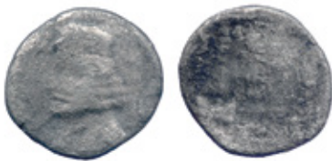
Orodes II, 57-38 BC Sellwood 1980, type 43.5 (?)