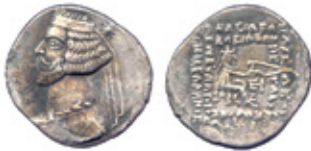
Mitridates III, 57-54 BC Sellwood 1980, type 41.14