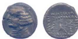
Orodes II, 57-38 BC Sellwood 1980, type 47.23