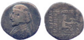
Unknown King, ca. 80-70 BC Sellwood 1980, type 30.16