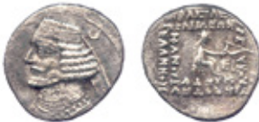
Orodes II, 57-38 BC Sellwood 1980, type 46.9