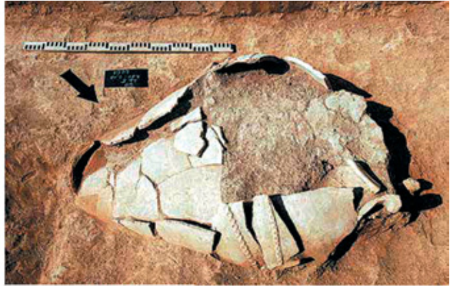
Նկ. 1. Երկրորդ կարասային թաղում, 2010 թ.