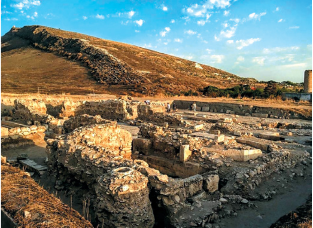
Նկ. 4. Տիգրանակերպ. Կենտրոնական տարածք