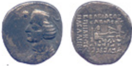
Orodes II, 57-38 BC Sellwood 1980, type 47.5