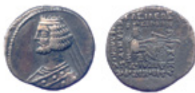
Orodes II, 57-38 BC Sellwood 1980, type 43.7