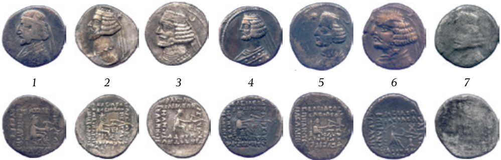
Տիգրանակերպի պեղումներով հայտնաբերված դրամներ