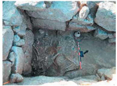
Նկ. 2. Քարարկղային թաղում, 2016 թ.