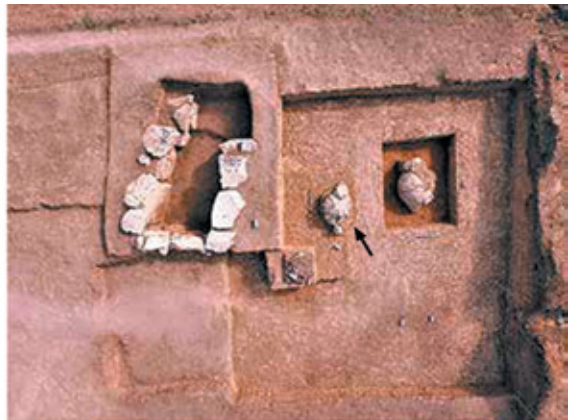
Նկ. 3. Հինգերորդ կարասային թաղում, 2017 թ.